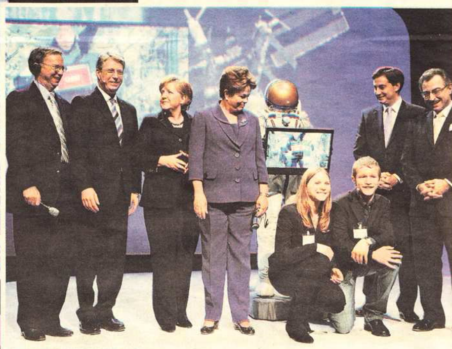
SVEČANO OTVORENJE Cebit 2012 otvorila je njemačka kancelarka Angela Merkel, a na pozornici su joj se pridružili uglednici iz IT svijeta