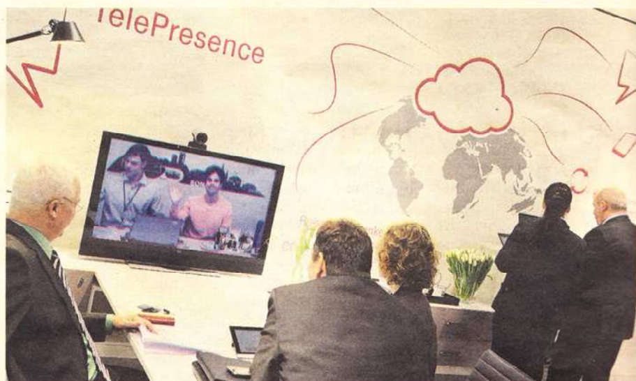
TELEKONFERENCIJE među temama su ovogodišnjeg Cebita

"Za razliku od ostalih sličnih open source rješenja ili komercijalnih proizvoda, naša tehnologija razvoja pokriva sve faze razvojnog procesa softvera i ima cjeloviti set funkcio-